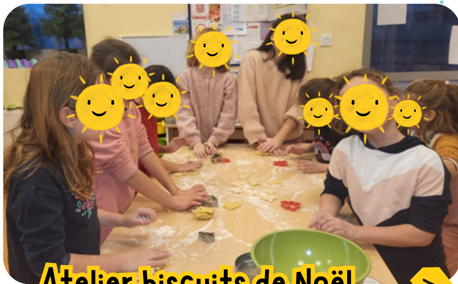
Atelier biscuits de Noël