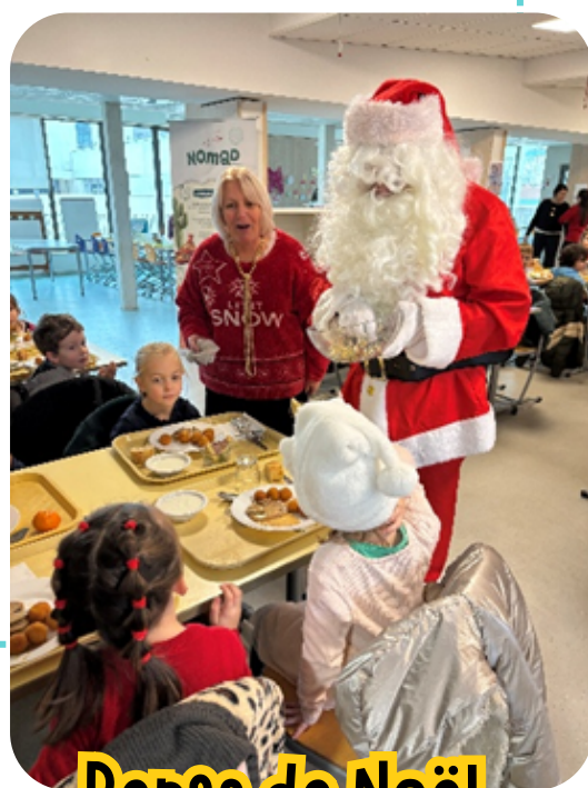
Repas de Noël